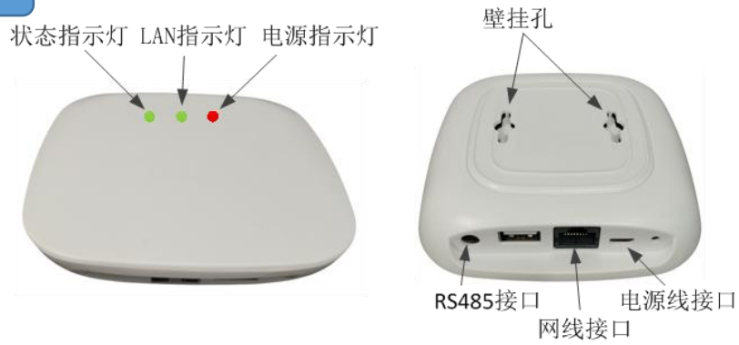
图 1 中央空调控制器