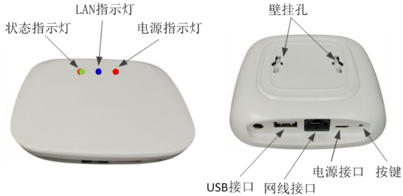
图 1 智能网关