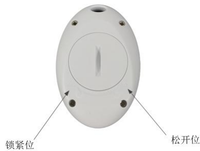
图 2 示意